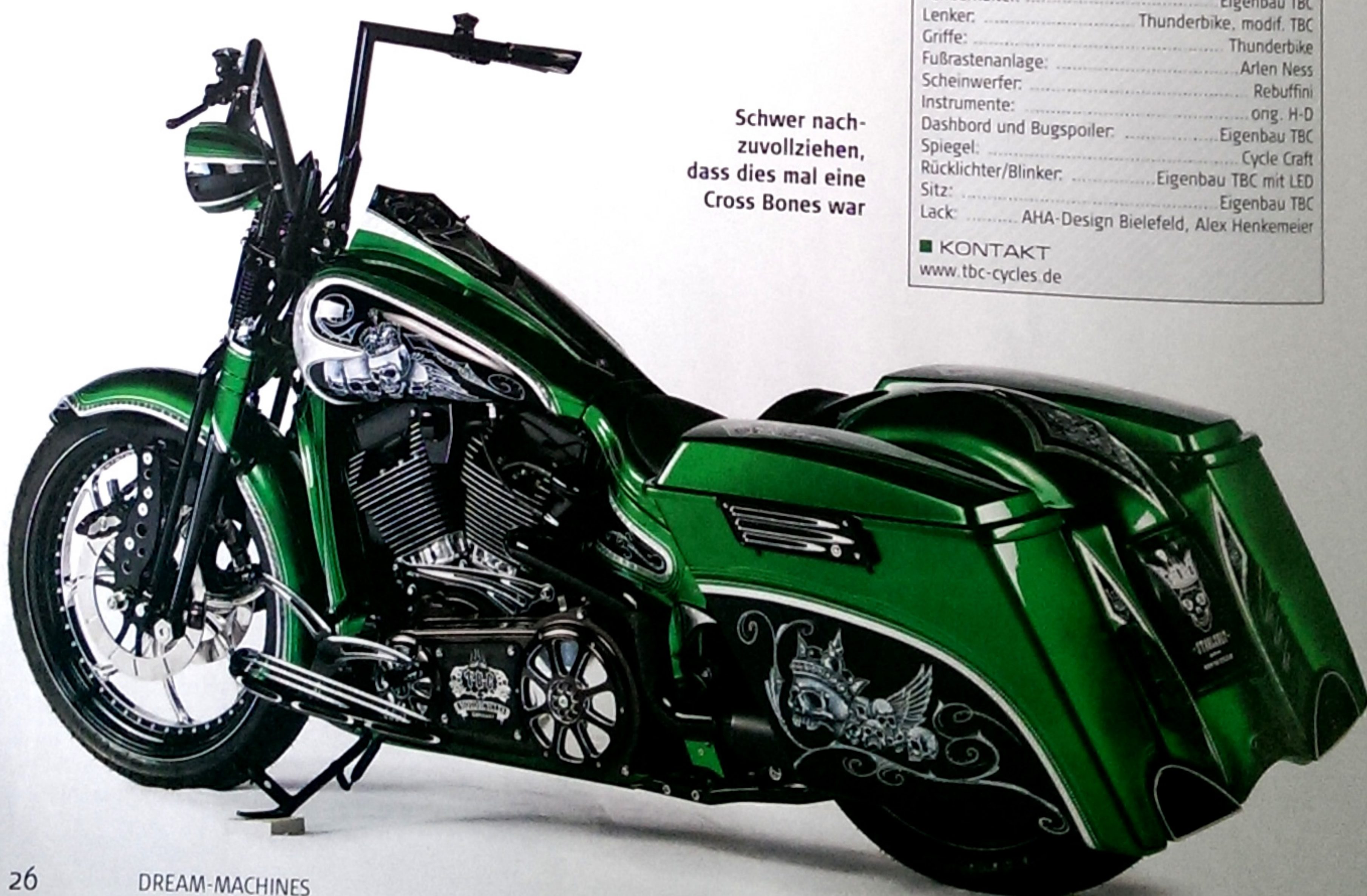
Schwer nach- zuvollziehen, dass dies mal eine Cross Bones war