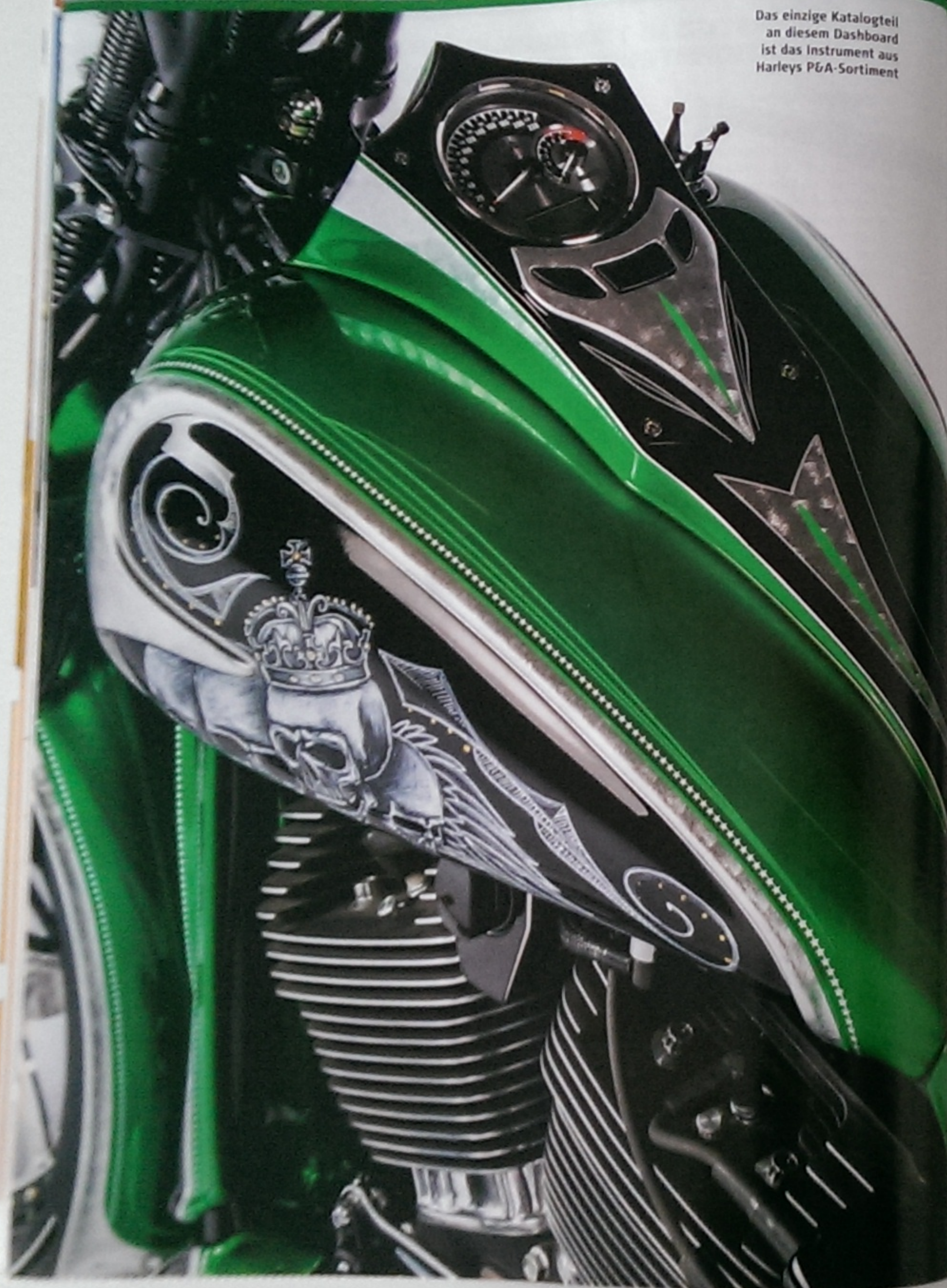
Das einzige Katalogteil an diesem Dashboard ist das Instrument aus Harleys P&A-Sortiment