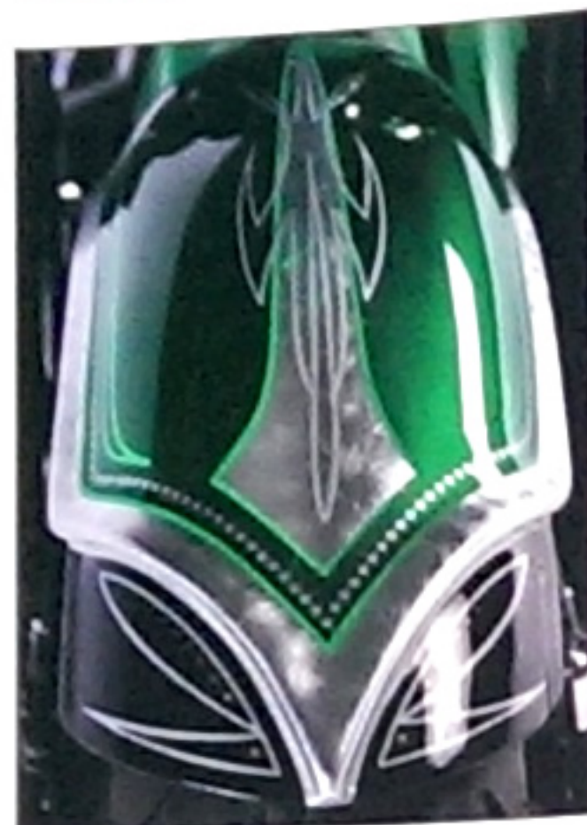
Symbiose: Die Lackierung von AHA-Design bringt die 3-D-Elemente der Blecharbeiten perfekt zur Geltung

Da das Hauptthema „Bagger“ hieß, mussten selbstredend „Bags“ ans Heck. Die Halterungen und Bügel zur Aufnahme der Koffer entstanden, wie alle anderen Metallarbeiten auch, bei TBC in Karlsruhe. Sehr aufwändig war auch die Anfertigung der Auspuffendkappen. Die Endstücke sind doppelwandig aus Stahl gebogen und geschweißt. Der äußere Rahmen wurde aus Edelstahl gebogen und verschraubt. Die Zahl „68“ im rechten Topf steht für das Geburtsjahr des glücklichen Besitzers.