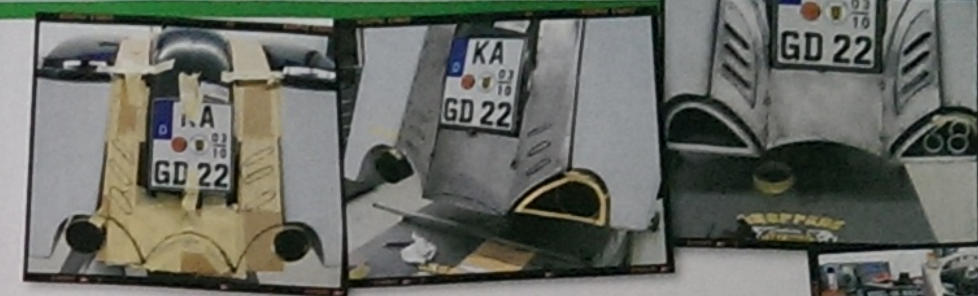
Ideenfindung per Pappschablone, erste Umsetzungen in Blech, mühsam ernährt sich das Eichhörnchen ...